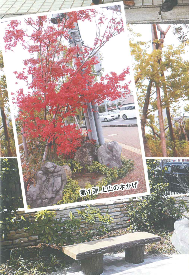
第1弾 上山の木かけ