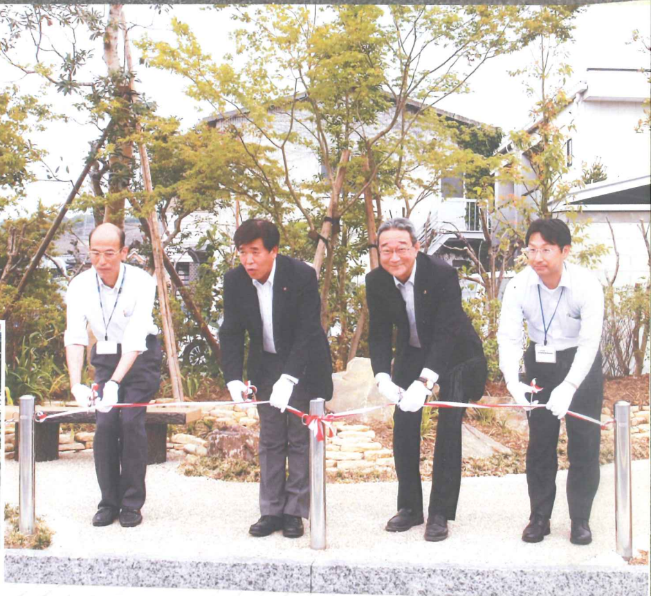
第2弾 金岡の木かけ