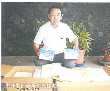
九州北部豪雨災害援助