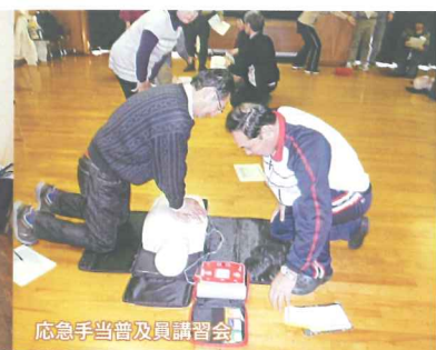
応急手当普及員講習会