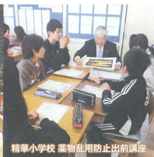
精華小学校 薬物乱用防止出前講座