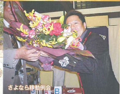
さよなら移動例会