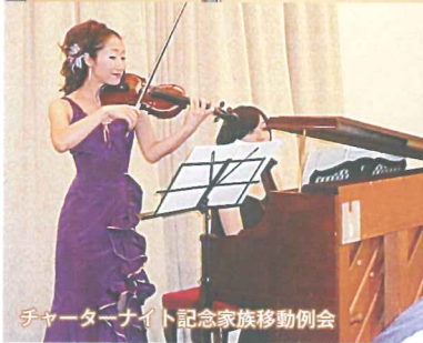
チャーターナイト記念家族移動例会