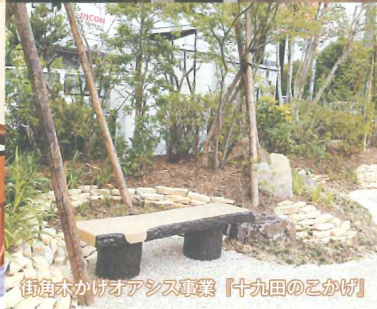
街角木かげオアシス事業『十九田のこかげ』