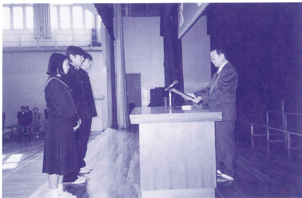
9年間皆出席者表彰式（3月11日）笠原中学校にて L. 亀山