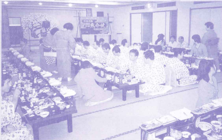
移動研修例会 懇親会風景