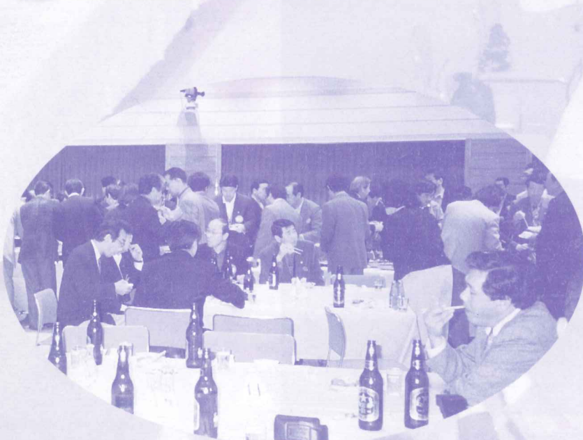
3クラブ合同例会 懇親会風景