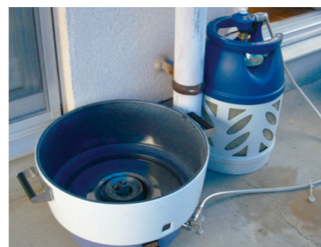
調理器具や暖房機器、給湯器にも接続可能です。