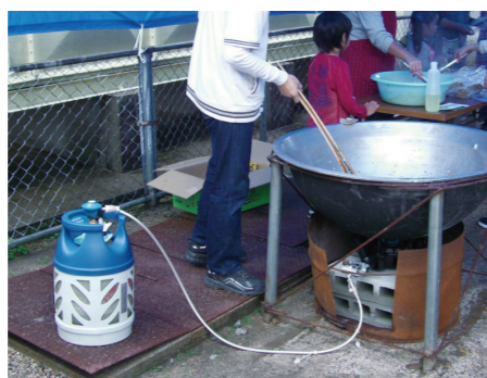
災害時の炊き出しに貢献。器具への接続も簡単。