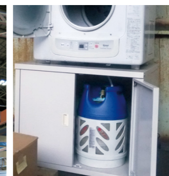
どこでも置ける。家電のようなスマートさ。レジャーやアウトドアライフを美的に演出。