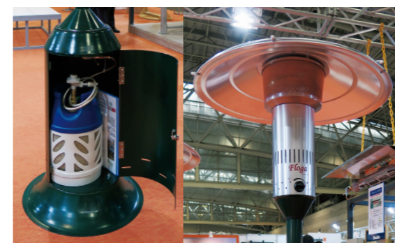
冬は暖房、夏はミスト冷房で、店舗のテラスを快適に。