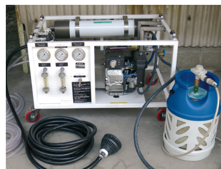
「そこにある水」を「飲料水」に浄化します。 ※災害時緊急避難用飲料水製造装置(ロッキーデュー)

プラコンポは、使う場所を選びません。コンロに。ファンヒーターに。衣類乾燥機に。その場で簡単に接続でき、すぐに使えます。さらに、キャンプやバーベキューなどアウトドアでの調理に加え、レストランやカフェテラスに設置したパラソル型の屋外ストーブにも使用できます。サビの心配がないので、船上や沿岸部の暖房にも活躍。軽々運べて、すっきり収まる。機能性と美観を備えたプラコンポで、暮らしに自由と美しさを。